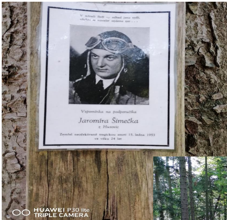
Vzpomínka na podporučíka Jaromíra Šimečka