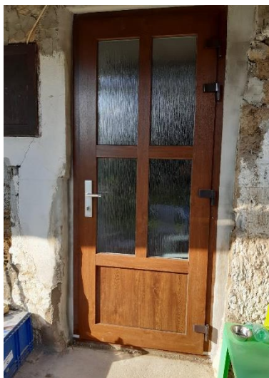
nové dveře – zvenku