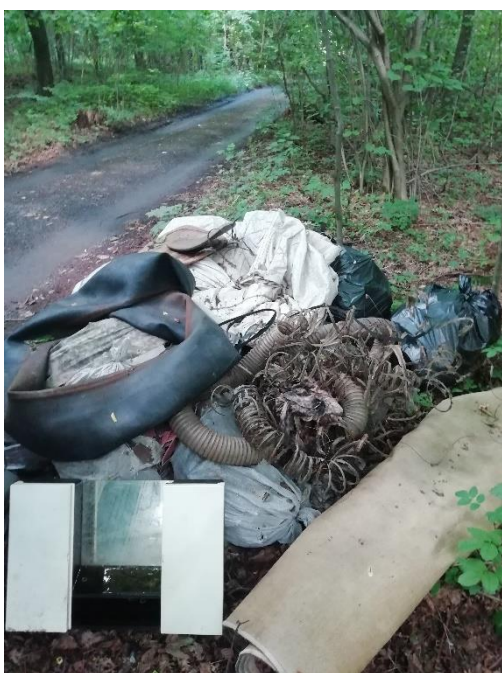
Lovětín a neustálý boj s odpadem