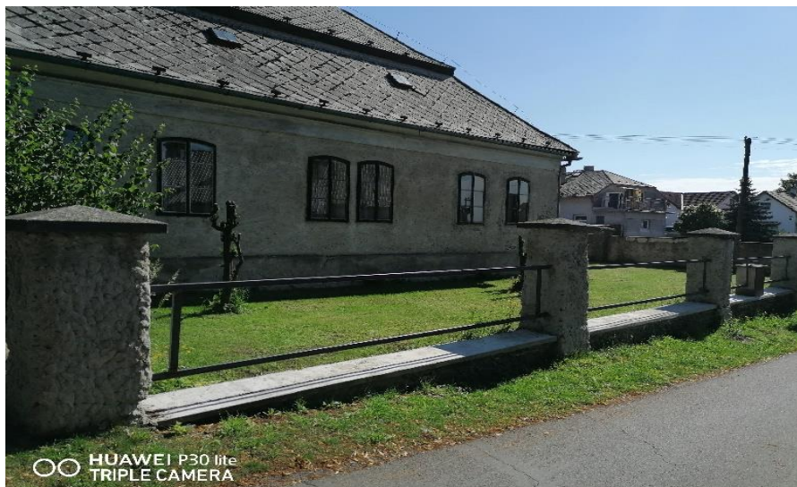
Rekonstrukce míčovské fary