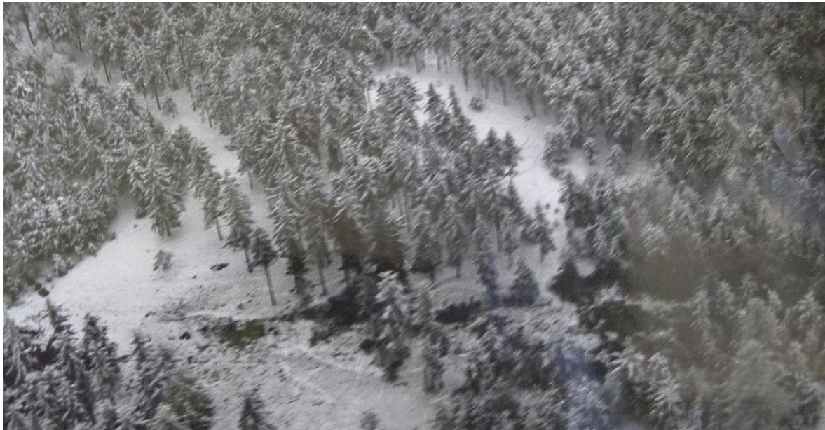
Letecký snímek havárie