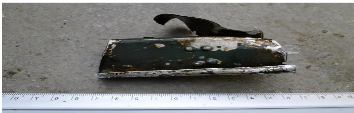
Torza havarovaného letadla v roce 1953