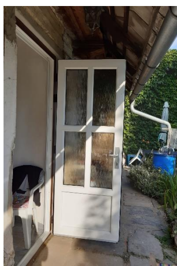
nové dveře – zevnitř

To byl pouze jeden z mnoha osobních příběhů, které se odehrávaly v povodňový den.