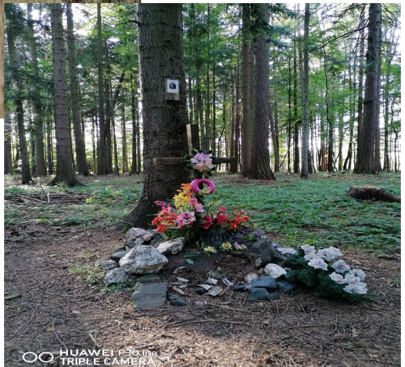
Pomníček připomínající tragickou událost pádu letadla