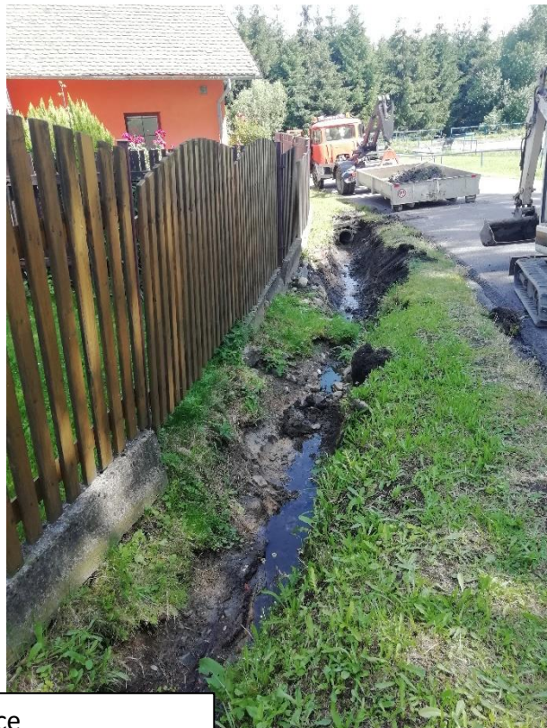
Sušice poškozené zatrubnění části příkopu a následná oprava