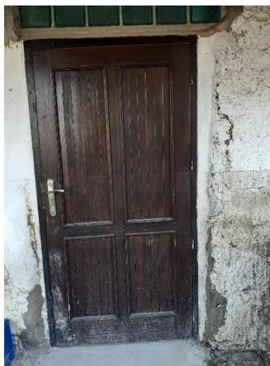
staré dveře čp.13

Děkujeme. Libuše Fidlerová rozená Táborská a rodina Táborská.