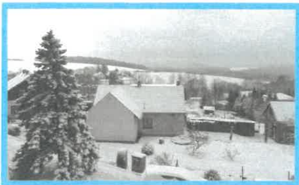
Zima na Míčově