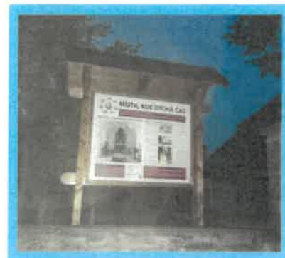
Instalace panelu Místa, kde dýchá čas